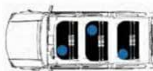
Vehículo de 9 plazas