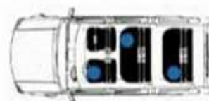
Vehículo de 7 plazas