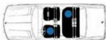
Vehículo de 5 plazas

IMPORTANTE: Puede haber excepciones cuando se traslade a hijos menores que no puedan dejarse solos, personas discapacitadas etc..., en cuyo caso podrían ir más de una persona por fila.... Pero en desplazamientos al centro de trabajo y similares, queda claro desde este momento, por lo que el interviniente deberá valorar esas excepciones.